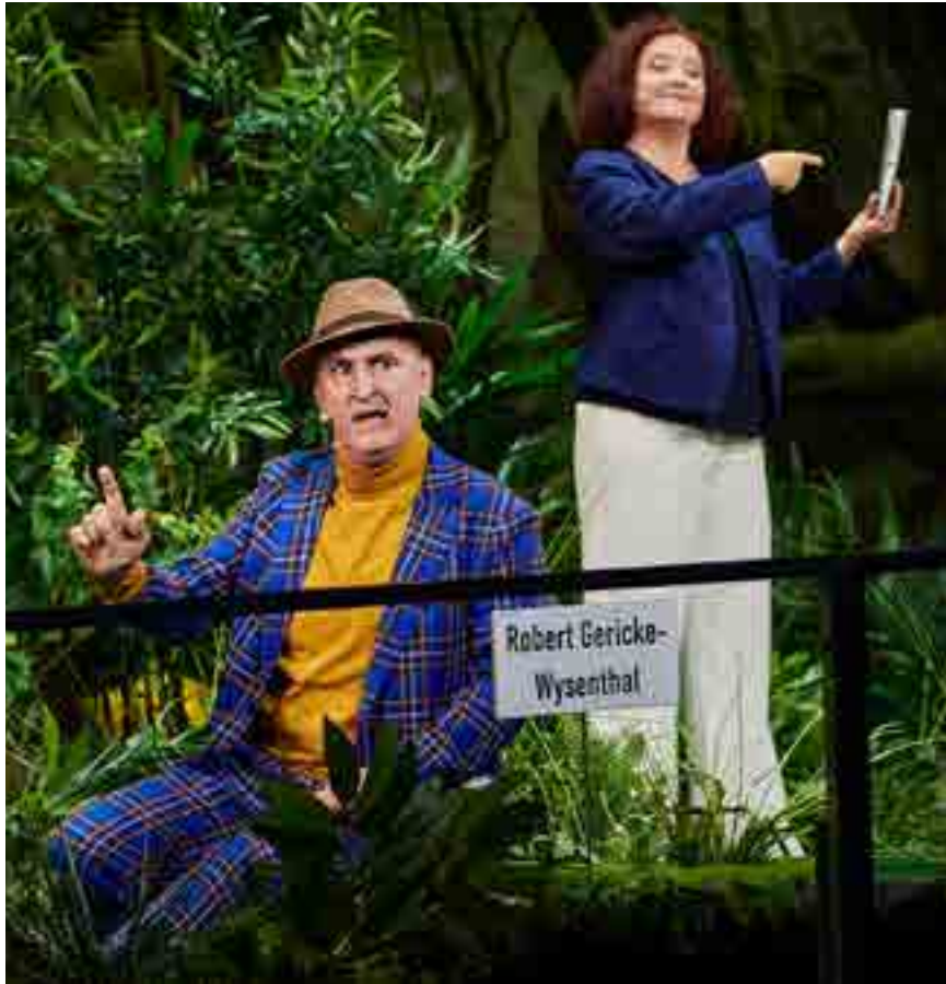
„Die Jury tagt“

Im März erwarten Sie zwei digitale Wiederaufnahmen und ein Live-Talk.